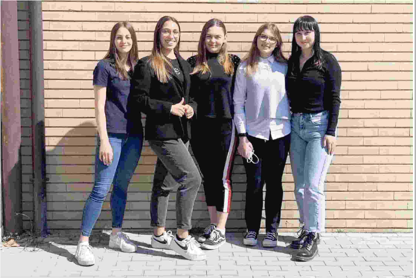
Le studentesse del Liceo scientifico Giovanni Marinelli di Udine che sono coinvolte nel progetto "La coscienza di Zeta" realizzato da Lactalis Italia